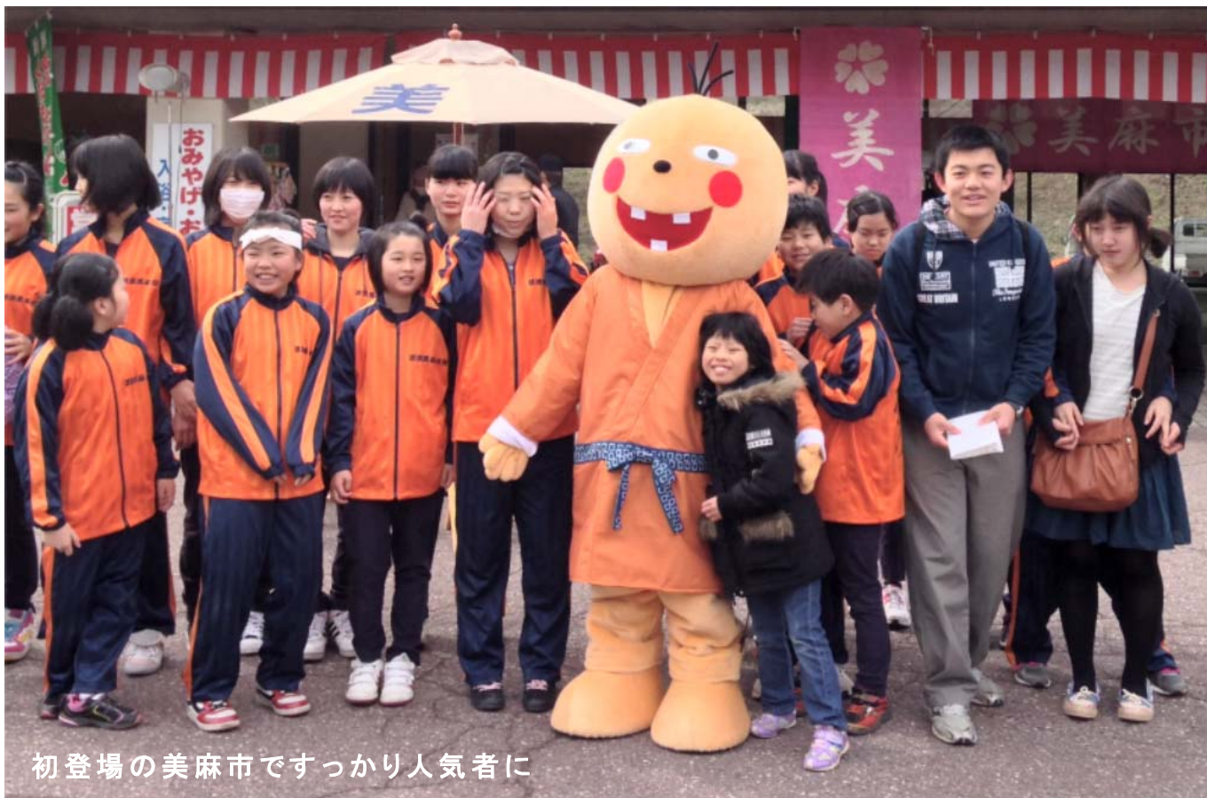
初登場の美麻市ですっかり人気者に