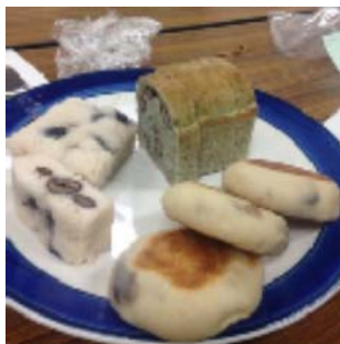
花豆を使ったパ ンの試作品