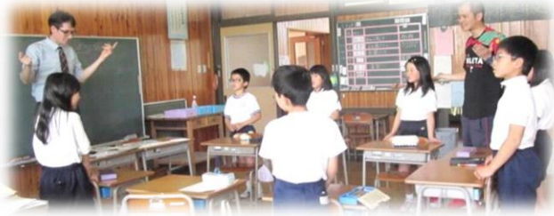
授業参観の様子から

PTA作業では、PTAや地域の皆様方のボランティアのご協力により、校地内外の草刈りや校舎内の清掃などを行いました。ご協力いただきました皆様のお蔭で学校全体がスッキリしました。誠にありがとうございました。