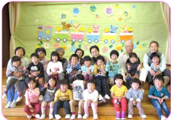
4月に舟場の皆さんと

1回目は舟場シニアの皆さん6名、2回目は大平寿会の皆さん22名が来てくださいました。園庭の草取り、周辺の草刈りをしていただき、その横で子ども達もはりきって草取りや草集めをしました。その後の交流会も楽しみの1つで、歌を歌って拍手をもらったり、一緒にゲームをして触れ合える貴重な時間を過ごすことができました。