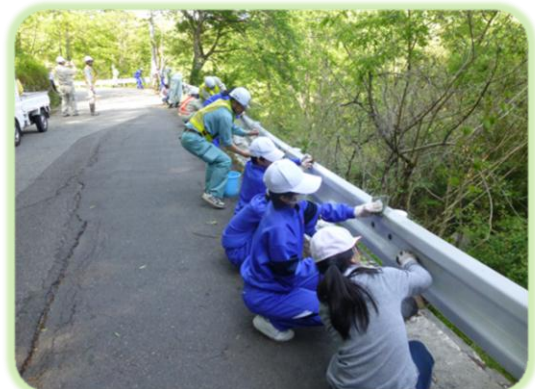
感謝の気持ちを込めて磨く

この日のために、シルバー人材センター八坂支部、八坂支所、八坂公民館、大町建設事務所、地域の建設業者の皆様、保護者や学校支援ボランティアの皆様が、下草刈り、給水、交通整理など児童生徒が安全に奉仕作業を行えるように配慮してくださり、安心して作業を終えることができました。ご協力に心より感謝いたします。