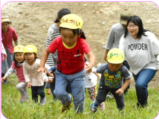
親子で斜面を登っています

すっかりきれいになった園庭では6月1日（金）に、こいのぼり運動会を開催しました。