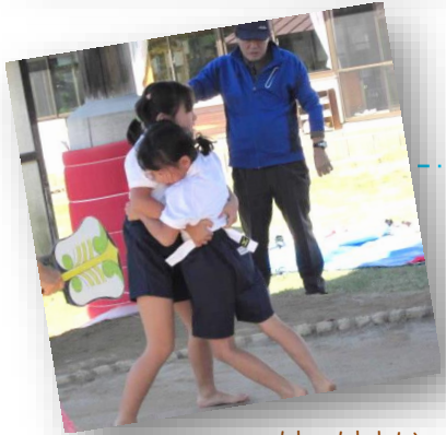
はっけよいのこった!