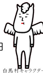
白馬村キャラクター ヴィクトワール・シュヴァルブラン・村男III世