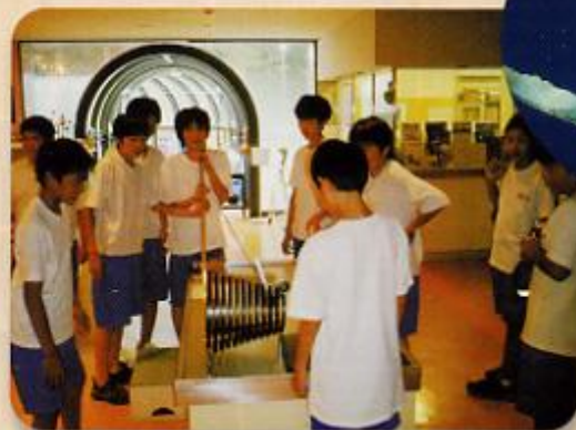
ボールコースター