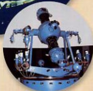
プラネタリウム(土・日・祝日 投影)