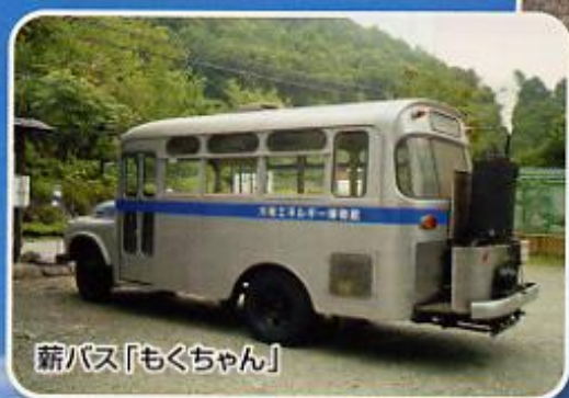
薪バス「もくちゃん」