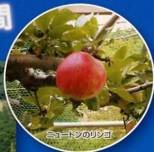
ニュートンのリンゴ