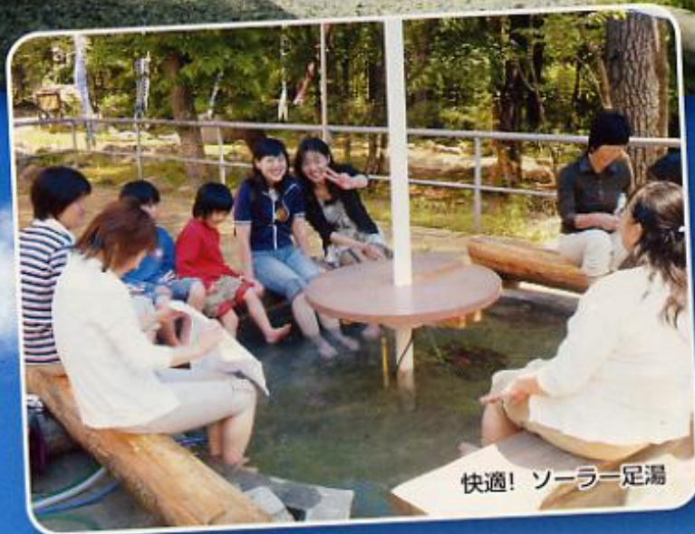
快適! ソーラー足湯