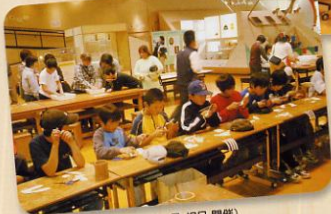
館内風景 手作りパズルが人気