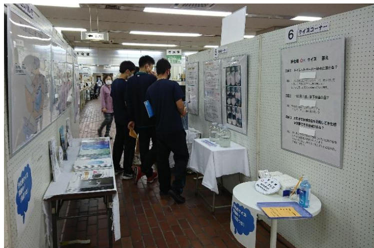
(高校生の見学の様子)