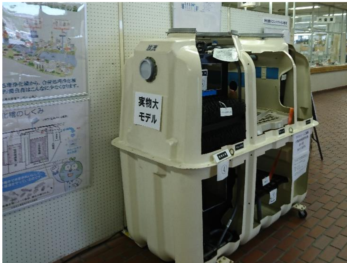
(フジクリーン製CA5型モデル)

地下に埋められ、普段は目にする事ののない浄化槽の外壁を取り外し、内部を丸見えにして、汚れた水が処理される仕組みが解るカットモデルを展示しました。