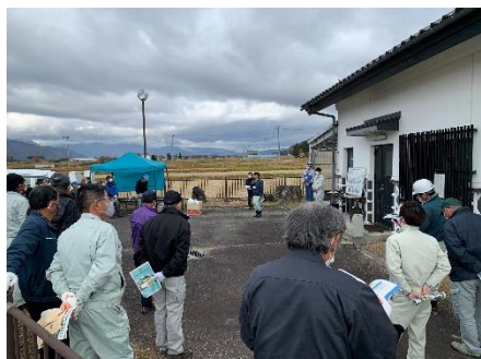
組合代議員、業者部会のみなさん

当該施設は、閨田、曾根原、宮本地区の計画処理戸数310戸の生活排水を処理している大町市の農業集落排水処理施設で、運転管理における乳酸飲料やクルトのプラスチック容器をろ材として再利用されていることや、試行錯誤を重ねて省エネを実現し、施設の電力使用量が約半分になったこと等の取り組みについて関心が寄せられ、参加者は汚水処理の重要性を再認識した。