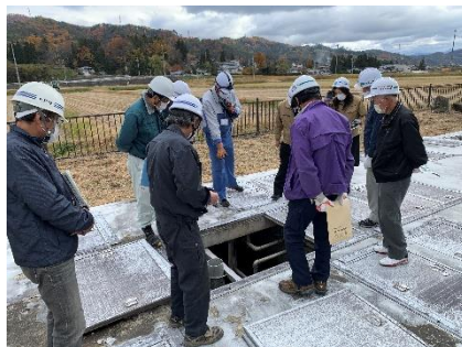
処理槽内部の観察