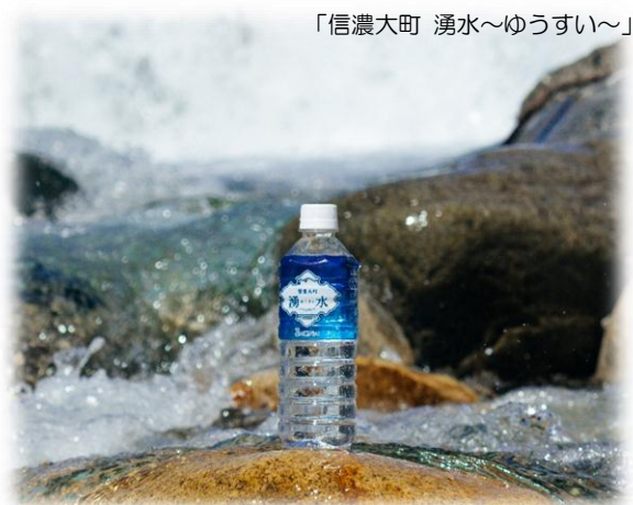
「信濃大町 湧水～ゆうすい～」

大町市企画による水道水源の水をペットボトル詰めした、ナチュラルミネラルウォーター「信濃大町 湧水～ゆうすい～」の販売が開始されました。この水は、「食のノーベル賞」とも称される“モンドセレクション2018”において最高金賞を受賞しています。