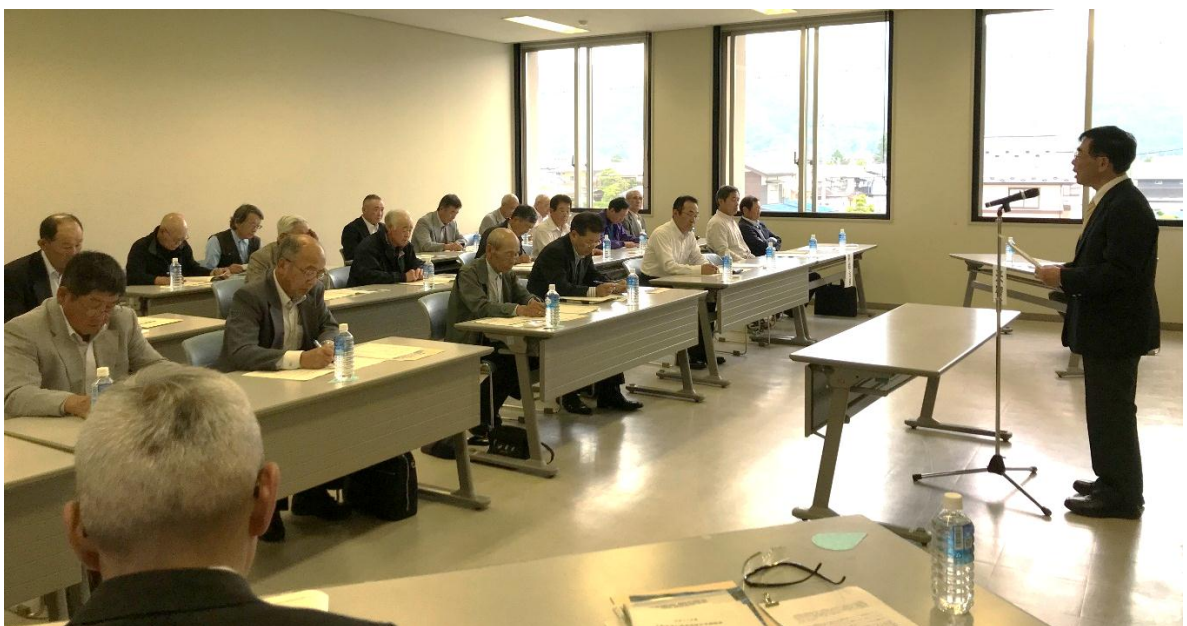
大町市役所東庁舎中会議室