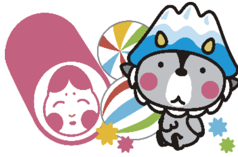
大町市キャラクター おおまぴよん