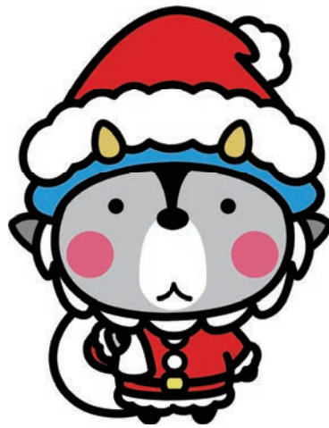
大町市キャラクター おおまびよん