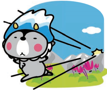
大町市キャラクター おおまびよん