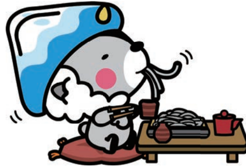
大町市キャラクター おおまびよん