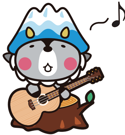
大町市キャラクター おおまぴょん