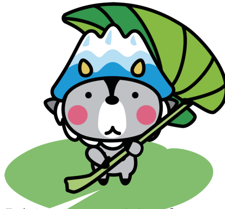
大町市キャラクター おおまびよん