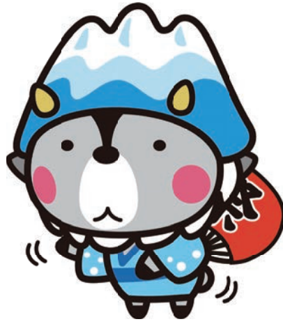
大町市キャラクター おおまびよん