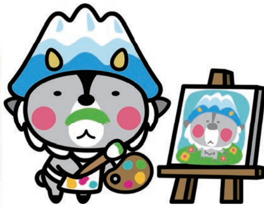
大町市キャラクター おおまびよん