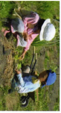
畑仕事や田植えなどの農作業も体験します。

一日の大半を野外で過ごす中で、自然を観察し、泥団子作り、木登り、川遊びや雪遊びを楽しみます。