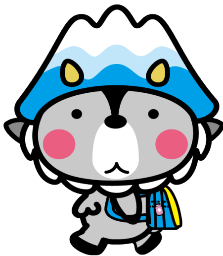
大町市キャラクターおおまびよん