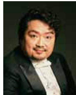
＜バリトン＞ 上江隼人