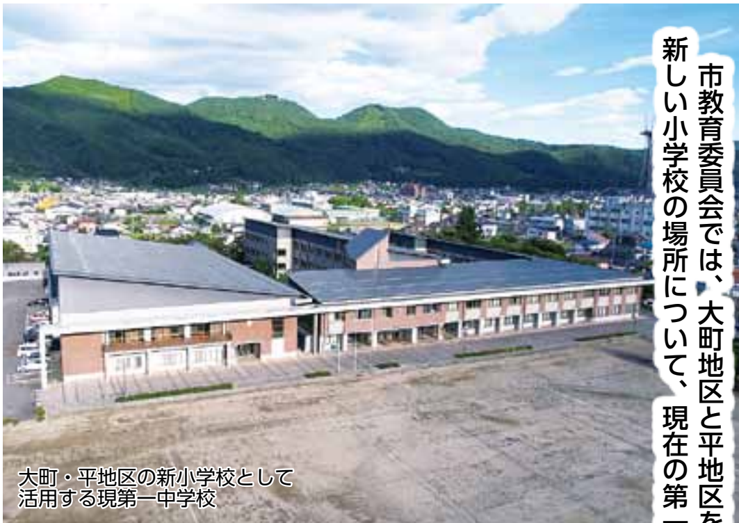
大町・平地区の新小学校として活用する現第一中学校

市教育委員会では、大町地区と平地区を通学区域とする新しい小学校の場所について、現在の第一中学校を選定しました。