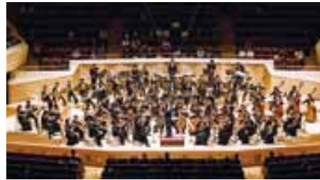
＜オーケストラ＞ 信州アルプス交響楽団