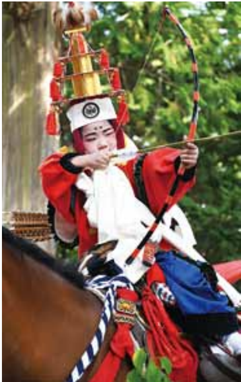
各町と相談を重ねる中で コロナ対応の祭りを実現した子供流鏝馬