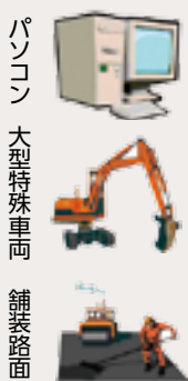
パソコン 大型特殊車両 舗装路面

申告期限は、令和5年1月31日(火)です。期限間近は大変混雑します。提出は、お早めにお願います。