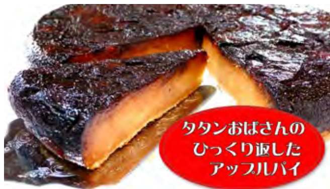
タタンおばさんの ひっくり返した アップルパイ

リンゴをたっぷり8個使用したキャラメリゼが魅力のデザート。欧米でリンゴのケーキと言えばタルトタタン、添加物を一切使わず伝統的な製法で8時間かけて焼くヘルシーな大人のスイーツ。