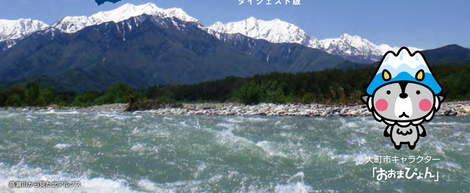
高瀬川から見た北アルプス