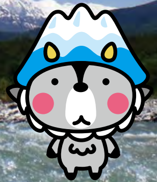
大町市キャラクター 「おおまひょん」