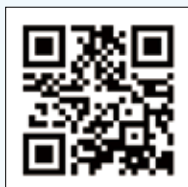
▲公式ホームページはこちら