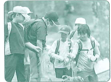
みどりの少年団交流集会