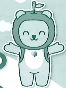
長野県PRキャラクター 「アルクマ」 ©長野県アルクマ