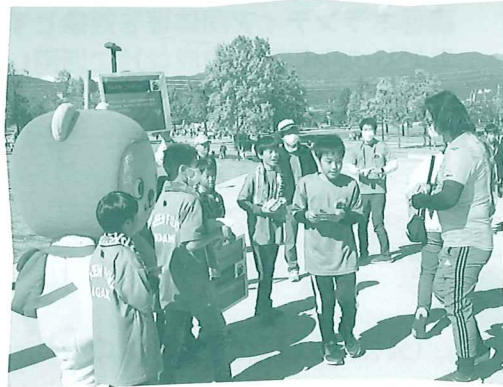
スポーツイベント会場での募金活動