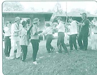
指導者スキルアップ研修会

各地区での身近な緑化活動や、 森林ボランティア団体等を対象とする公募事業、 みどりの少年団の育成などに活用しています。