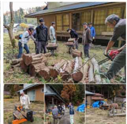
伐採した木の片付け作業

地域の課題解決に向けた新たな取り組みとしてワークキャンプの受け入れを行いました。美麻地区では、「国際ボランティアNGOのNICE(注)」と連携して、全国各地から6名の参加者が集まり、11月3日からの3日間、①有害鳥獣駆除の括り罠の設置体験、②新行水車小屋のかやぶき屋根葺き替え作業、③空き家の片付けで伐採した木の片付け作業、④森林公園の整備などの活動を行いました。地域住民との交流会では参加者から「今回のプログラムは、罠の設置や薪割りなど初めて体験す