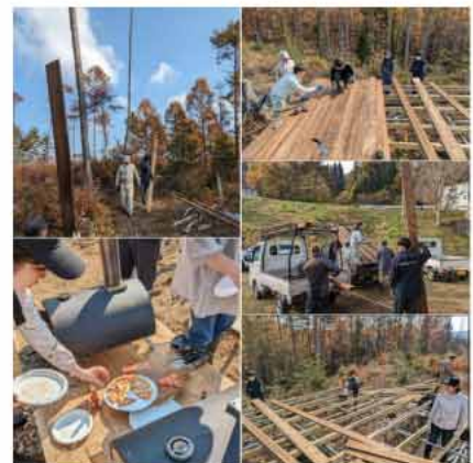
森林公園の整備作業

区の支援に来ていただいたボランティアの皆さんに、この場を借りて感謝申し上げます。ありがとうございました。