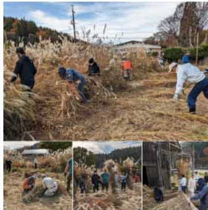
かやぶき屋根葺き替え作業