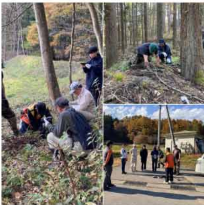
括り罠の設置体験