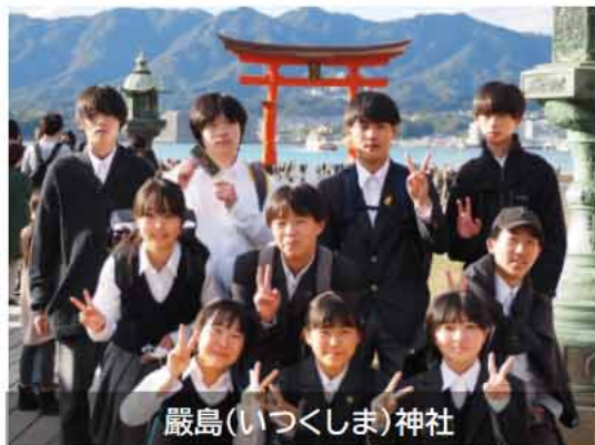
厳島(いつくしま)神社

10月29日から31日までの3日間、素晴らしい晴天に恵まれた最高の修学旅行となりました。広島では原爆ドームで爆発の激しさを感じ取り、資料館では想像を超えた資料の数々に言葉もなく見入っていました。百聞は一見に如かずの言葉通り、子どもた