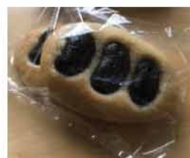
今年は、美麻小中学校の生徒が商品開発した花豆のパン「美麻のミ」をご賞味いただきました。

高揚を図りつつ、ふるさと美麻との絆を深めるとともに、わがまち散策会や隔年でのふるさと・紅葉文化祭ツアー、秋の定時総会及び懇親会などを通じて会員相互の親睦を深めていただきました。また、近年では会員の皆さんの芸術作品を美麻地区文化祭に出品していただいたり、神代断層地震の折に震災義援金を送っていただいたり、ふるさと納税にもご協力いただいております。発足時に200名ほどいらっしゃった会員も高齢化とともに減少して、会員の確保が課題となっているとこのことです。関東方面にお住いの美麻地区出身者の方がご家族や、ご親戚にいらっしゃいましたら、ぜひ美麻地域づくり会議事務局（美麻支所総務係）までお知らせください。