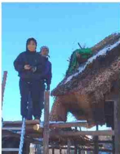
茅葺屋根のふき替えを体験