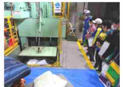
大きなゴミを破砕機で細かくしています