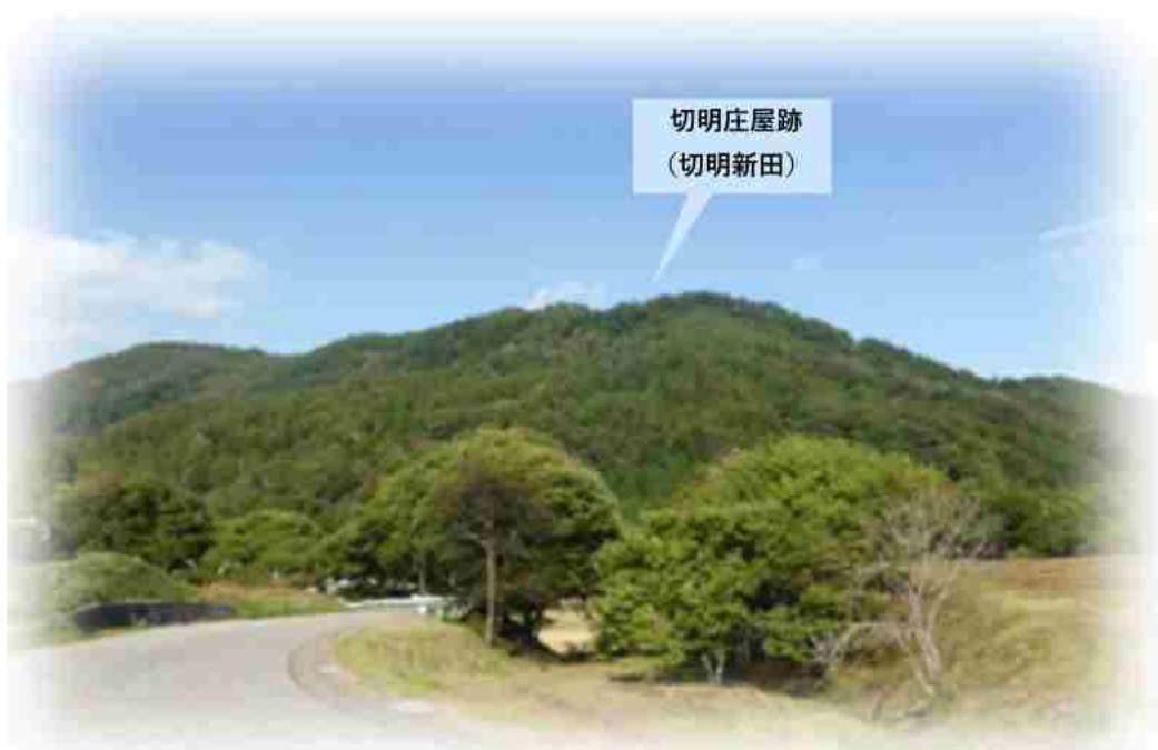
切明庄屋跡 (切明新田)