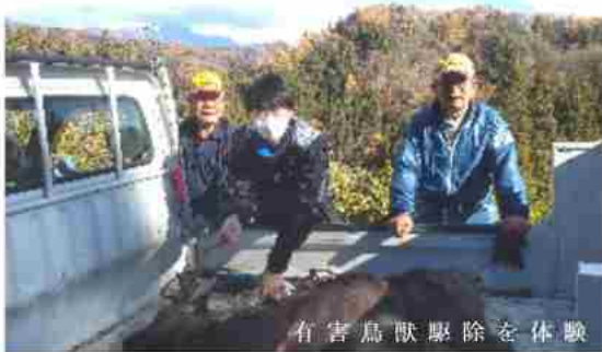
有害鳥獣駆除を体験

今年度から、地域活性化を目的とした新規事業として、「信濃大町ワーキングホリデー（ふるさとワーキングホリデー：総務省）事業」に取り組んでいます。前回の通信での報告に続き、お2人を受入れました。