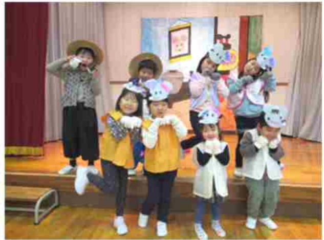
発表参観の劇「おむすびころりん」