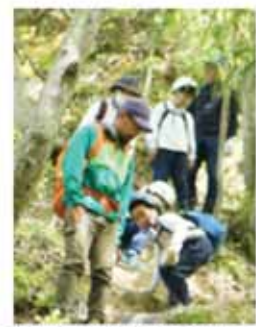
しっかり見守っていただきました