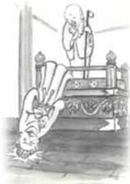
絵：荒井泰三画伯 (大町の民話美麻・八坂編より)

このお堂には、薬師(やくし)瑠璃光(るりこう)如来像(にょらいそう)と地藏(じそう)菩薩像(ぼさつそう)の二体の本尊様が一緒に祀られている。地藏様は、隣の集落の小境(こさけ)の西の山にあった安平寺(あんべいじ)の本尊様。一方、薬師様は、小奈良尾の坪川(つぼかわ)のお堂の本尊様。それぞれ廃寺となった本尊様を地元の人々はそのまま捨ててはもったいないことだといって、小奈良尾にお堂を建てて祀った。ところが、夜な夜な荒々しい物音が聞こえる。近所の人たちは気味悪がり見に行くと、二体の本尊様は背中合わせになっていた。直して置くと、また荒々しい音がし、背中合わせになりたり転んでいたりしている。