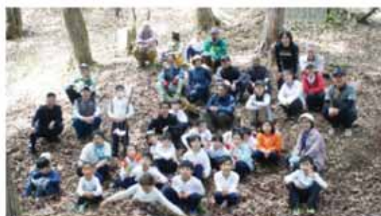
大勢のボランティアの皆さんと本丸あとにて