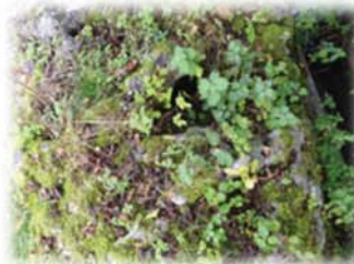
岩の上に登って、真ん中のくぼみを撮った写真。いつも水がたまっています。