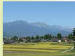
東山山麓・塩の道から北アルプス