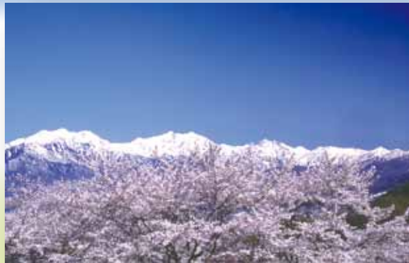
北アルプスと桜並木

大町市文化会館をスタートし、北アルプスの展望が美しい東山の山麓を走るコース。春には桜並木が美しい観光道路と塩の道を守る。沿線には文化財が多く、歴史ロマンを感じる道。また、うっそうと茂る森に囲まれた国宝仁科神明宮では荘厳な雰囲気にも包まれる。仁科神明宮にお参りしたあとは、北アルプスに向かって走ろう！