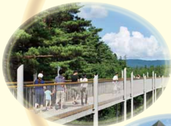
国営アルプスあづみの公園 大町・松川地区