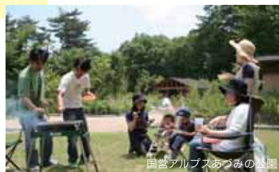
国営アルプスあづみの公園