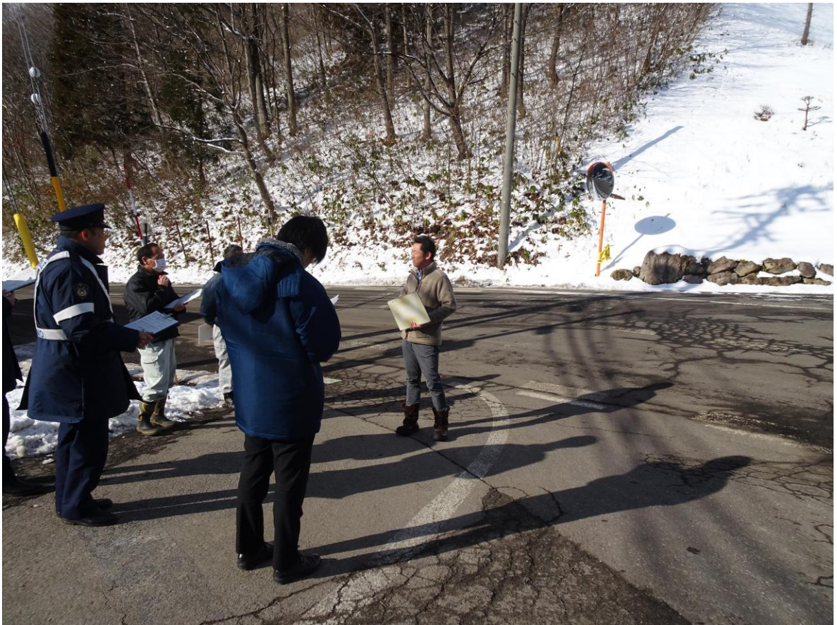
【合同点検（令和2年2月）・美麻小中学校区内】

今後は、本プログラムに基づき、関係機関が連携をさらに密にして、児童生徒が安全に通学できるように通学路の安全確保を図っていきます。