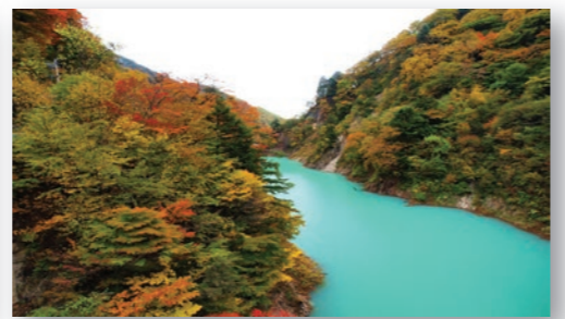
高瀬渓谷 紅葉の美しさが県内有数の名勝地として知られる。槍ヶ岳を源流とする高瀬川には、上流から高瀬ダム、七倉ダム、大町ダムが続く。