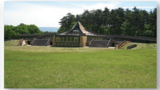
国営公園アルプスあづみの公園 大町・松川地区 北アルプスの山岳景観につながる森林に囲まれた公園。平成21年7月にオープンし、さまざまな体験施設で楽しむことができる。