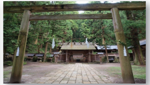
国宝・仁科神明宮 国宝の本殿・中門・釣屋は、わが国最古の神明宮造り。ここでは、往古からの伝統行事が今もとり行われている。