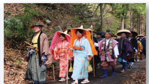
塩の道まつり 例年ゴールデンウィークに開催され、残雪の北アルプスの素晴らしい景色を楽しみながら塩の道を歩くウォーキングイベントです。