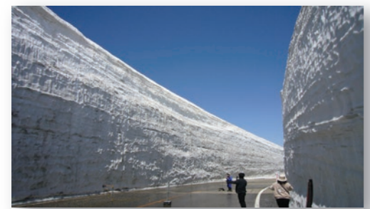
立山・雪の大谷 標高2,450mの立山室堂平には、深さ20mに迫る雪壁が約500m続く。