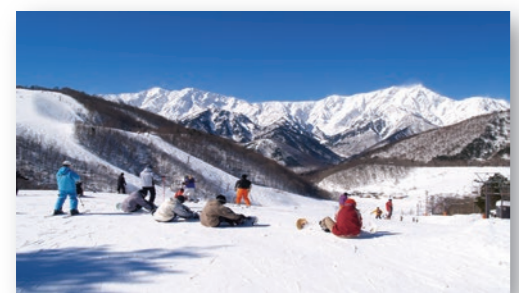
スキーリゾート 大町市には、サンアルピナ鹿島槍スキー場、ヤナバスキー場、爺ガ岳スキー場の個性的なスキー場があり、県内外から多くの観光客が訪れている。