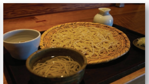
味覚 アルプスの麓に湧き出るおいしい水や澄んだ空気など、大自然から生まれた地酒や信州そば、おやき、りんごなどはぜひご賞味を！