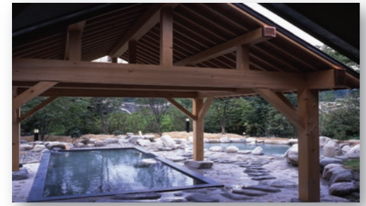
大町温泉郷 黒部ダムに通じる大町アルペンライン沿いの鹿島川のほとりに、林に囲まれた自然との調和が美しい静かな温泉郷。