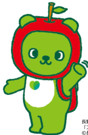
長野県PRキャラクター 「アルクマ」 ©長野県アルクマ

東京圏や愛知県、大阪府からの採用をお考えの企業等の皆様には、登録をおすすめします。